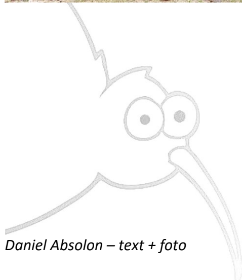
Daniel Absolon – text + foto